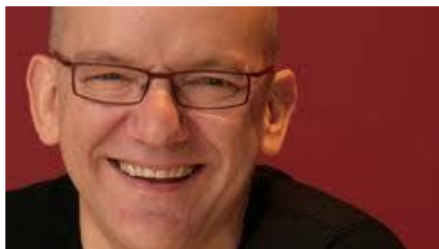
Bob Chilcott, componist Salisbury Vespers